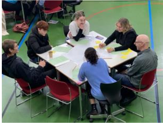
1 - Nemendur og kennarar ræða um jákvæð samskipti og setja hugmyndir á blað.

með slembiúrtaki nemenda, tveir úr hverjum bekk, auk 30 starfsmanna sem einnig voru valdir með slembiúrtaki. Alls voru þátttakendur á þinginu 103. Raðað var á 6-8 manna borð og fékk hvert borð ákveðið þema til að vinna með út frá þeim upplifunum sem flokkuðust undir þemað. Unnið var með fjögur þema, viðmót, tengsl, umgengni og heilbrigði. Hvert borð fékk það hlutverk að setja niður leikreglur eða setningar sem byrjuð á “við ætlum alltaf að .....” og “við ætlum aldrei að .....” . Þessar setningar verða svo notaðar til að móta samskiptasáttmála skólans.